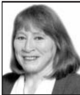
L'Honorable Ethel Blondin-Andrew, secrétaire d'État (Enfance et jeunesse)